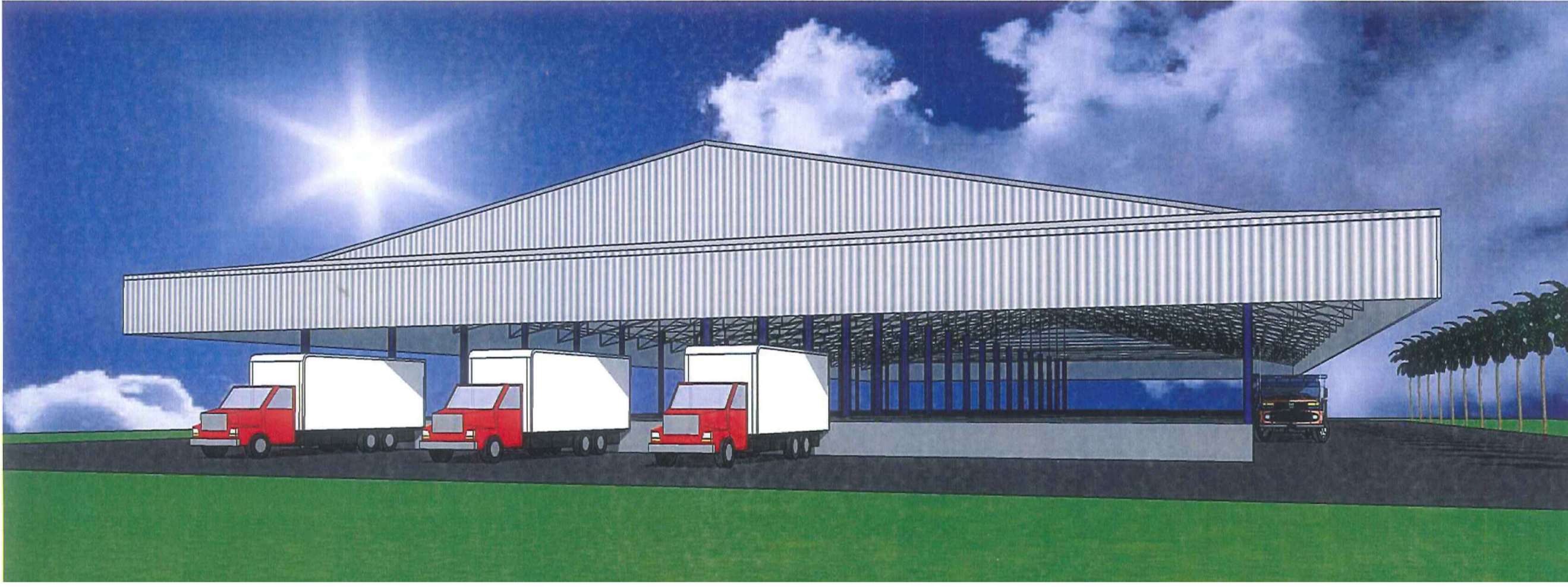
PERSPECTIVA SEM ESCALA